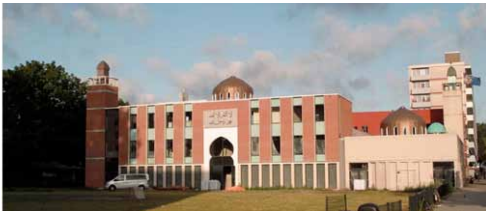
Oumma El Islaminia aan het August Allebéplein, bouwjaar 1992.

De El Oumma El Islaminia in Slotervaart/Overtoomse Veld is de eerste moskee in de Westelijke Tuinsteden. Net als in de jaren vijftig maakten moslims tot de oplevering in 1992 gebruik van noodvoorzieningen, zoals een ruimte boven een winkel.