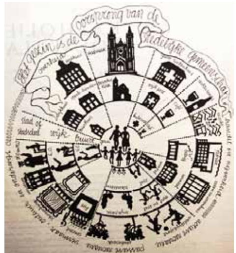
Het gezin is de oorsprong van de stedelijke gemeenschap.

Melchers noemt het opmerkelijk dat stedenbouwkundigen na de oorlog het kerkgebouw met daaromheen de kerkgemeente als ruimtelijk concept presenteerden, of het nou een 'wijk' heette of een 'parochie'. Dit zou er volgens haar mee te maken kunnen hebben dat de oorlog de waardering voor de kerk had doen toenemen.