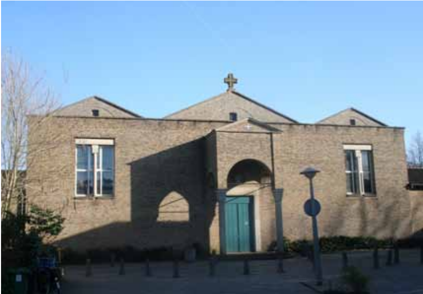
Lourdeskerk in de huidige situatie aan het Granpré Molièreplein in de buurt Noorderhof.