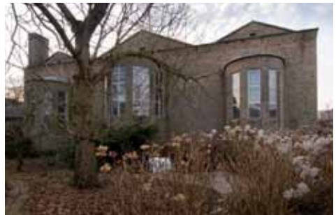
Achterzijde van de Lourdeskerk.

Toen de Lourdeskerk gebouwd werd was er al sprake van een zekere gedateerdheid van het ontwerp. De Delftse school waar Granpré Molière deel van uit maakte was eind jaren vijftig nog volop in zwang, maar zou daarna snel plaatsmaken voor het modernisme. Granpré Molière maakte zoveel mogelijk gebruik van natuurlijke materialen, en liever niet van (gewapend) beton zoals de modernisten. In de Lourdeskerk zijn veel historische verwijzingen naar de vroegchristelijke kerkbouw in Toscane en naar de romaanse architectuur. De sobere uitvoering verwijst naar de positie van de rooms-katholieke kerk in na-oorlogse tijd, een periode van herbronning en bezinning. De kerk moest van de grond af weer worden opgebouwd, net als de nieuwe wijken, en zou daarmee haar positie in de samenleving weer hervinden. De vroegchristelijke architectuur paste bij het pionierskarakter van de naoorlogse rooms-katholieke kerkbouw. Met het ambachtelijk gebruik van materialen en het tonen van de constructie, lijkt Granpré Molière door architect Berlage beïnvloed. Opmerkelijk is dat de rechthoekige vensters wel betonnen lateien hebben, waarschijnlijk om constructieve of economische redenen.