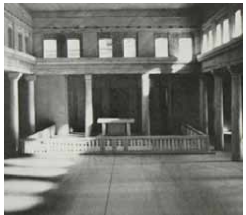
Maquette en realisatie van de Catharinakerk.