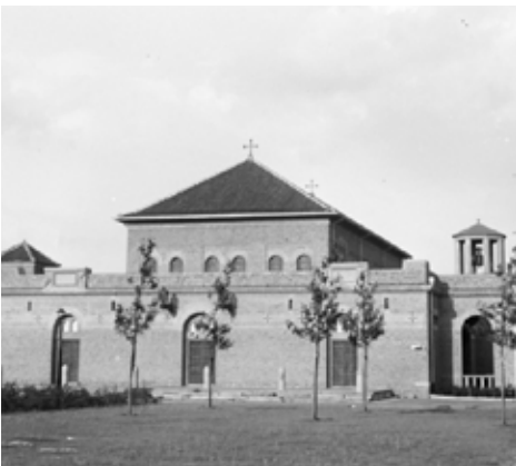
Catharinakerk met nog jonge bomenaanplant.

De Catharinakerk meer noordelijk in Slotermeer is ontworpen door de architecten Evers en Sarlemijn. De overeenkomsten tussen de Lourdeskerk ontworpen door Granpré Molière en de Catharinakerk zijn heel opvallend, en niet toevallig. De rooms-katholieke kerken moesten er in die tijd bijna Romaans en vroegchristelijk uitzien. Voor weinig middelen kun je dan niet veel anders doen dan een rechthoekige ruimte scheppen. Beide kerken zijn zonder toren uitgevoerd, en in beide kerken is de ruimte driebeukig, met een naar voren geschoven priesterkoor. De Catharinakerk heeft geen hoofdabcis. De Lourdeskerk heeft wel een kleine abcis achter het priesterkoor. Verder zijn beide kerken sobere ruimtes, met ongeveer dezelfde afmetingen en voor hetzelfde aantal gelovigen gebouwd. Beide kerken liggen perifeer, op kruispunten en langs een groenstrook. Een verschil is dat de Catharinakerk gebouwd is in de vorm van een basilica, en de Lourdeskerk als een hallenkerk.