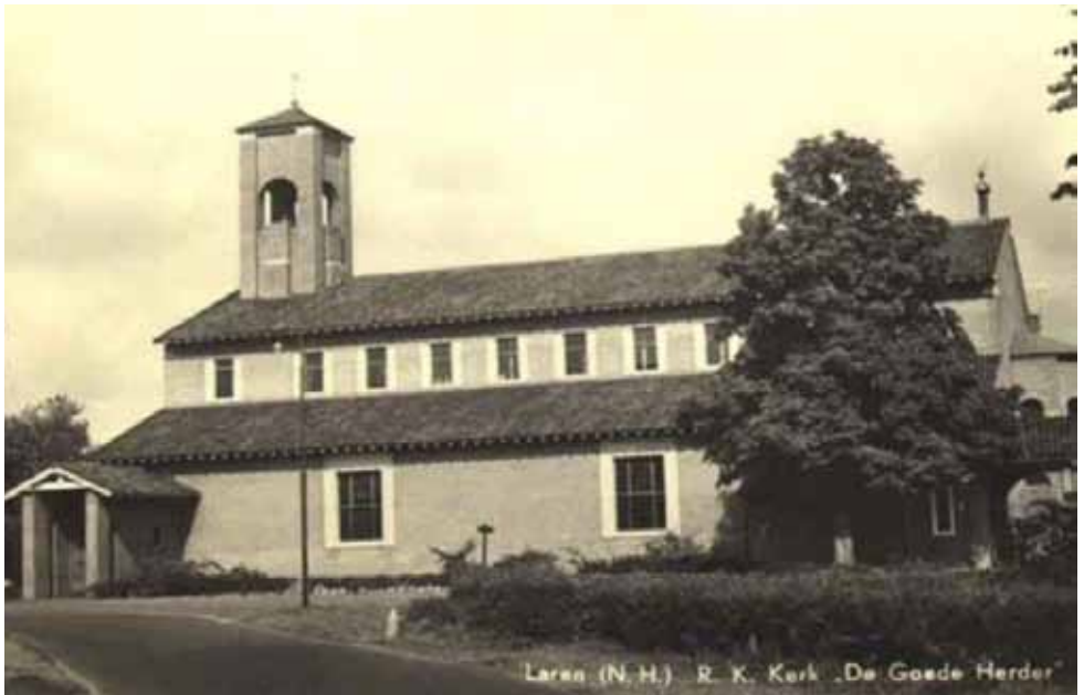
Ansichtkaart van rooms-katholieke kerk 'De Goede Herder' in Laren.

De pilaren staan ver uit elkaar zodat de gelovigen het priesterkoor goed kunnen zien. De Larense kerk (1956) had een sobere, doch monumentale uitstraling en vertoont veel gelijkenis met de Lourdeskerk.