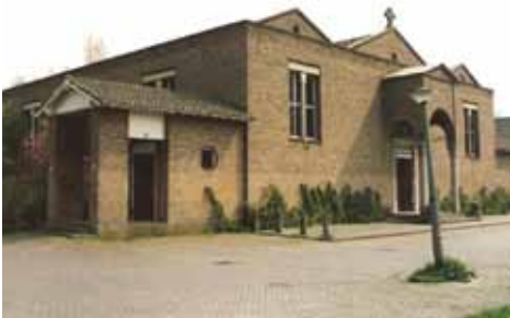
Voorzijde van de Lourdeskerk.

De Lourdeskerk heeft van oudsher geen dominante ligging, maar de nadruk wordt verkrengen door een lommerrijke ligging aan de rand van de stad. Granpré Molière bouwde ook de Onze Lieve Vrouw van Eeuwigdurende Bijstand in Breda-Heuvel (1954). Beide kerken onderscheiden zich nadrukkelijk als geestelijk middelpunt. In de Bredase wijk was de bevolking er homogeen katholiek. Een belangrijk verschil met Amsterdam Slotermeer en haar gemengde bevolking.