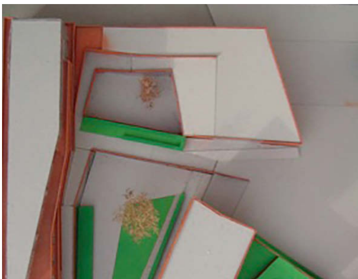
Bovenaanzicht maquette Blauwe Moskee en omliggende gebouwen. Beeld: Haiko Meijer

Iedere beslissing bracht weer nieuwe vragen met zich mee. Onder een minaret mag niets gebouwd worden, en op een koepel ook niet. Dat maakte het geïntegreerd bouwen wel lastiger, vertelt Meijer. Bovendien was het niet de bedoeling dat de bergingen, woningen en de parkeergarage in het oog zouden springen bij het betreden van de gebedsruimte. De Marokkaanse gemeenschap wilde wel graag commerciële ruimtes gekoppeld aan de moskee. Die kwamen er, maar worden nu niet als zodanig gebruikt. 'Op de wasruimtes is daarentegen enorm beknibbeld, waardoor die eigenlijk te klein zijn. De vierkante meters van de commerciële ruimtes hadden naar de wasruimtes gemoeten,' vindt Meijer.