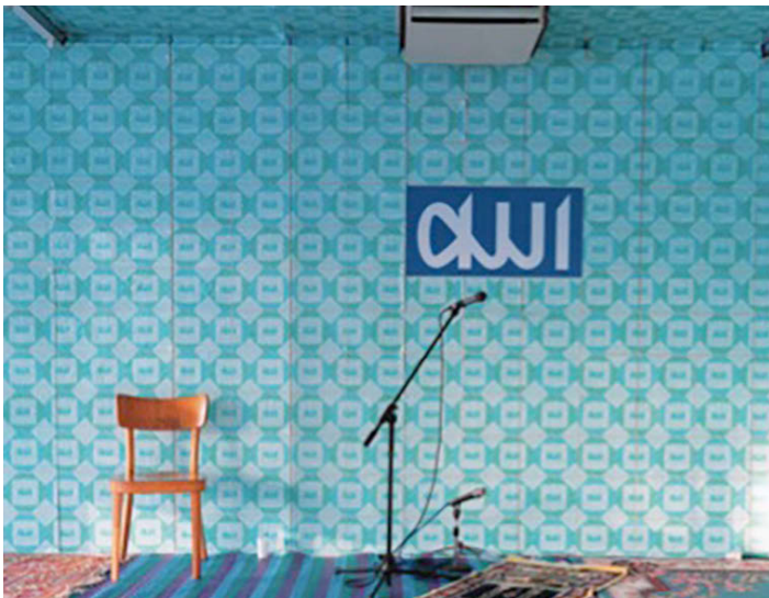
Albert Heijnmoskee in Amsterdam. Beeld: Bastiaan Franken en Tarik Sadouma.

En dan de Albert Heijnmoskee. Een moskee is in wezen een ruimte waar je kunt bidden. Er zijn geen voorschriften hoe de moskee eruit moet zien. Deze garage stond leeg en kreeg tijdelijk de bestemming gebedshuis. Op de muur staat Allah in Arabische tekens gebaseerd op het AH - lettertype. Architecten/bedenkers zijn Bastiaan Franken en Tarik Sadouma.