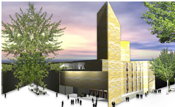
Ontwerp multi- functionele moskee door Concept0031. Beeld: Gentlemen A.R.T.

Afsluitend stelt Bugdaci dat er uiteindelijk maar een vierkante meter nodig is om te bidden. Misschien ziet de toekomst er wel zo uit: bidden kan tenslotte ook achter je pc.