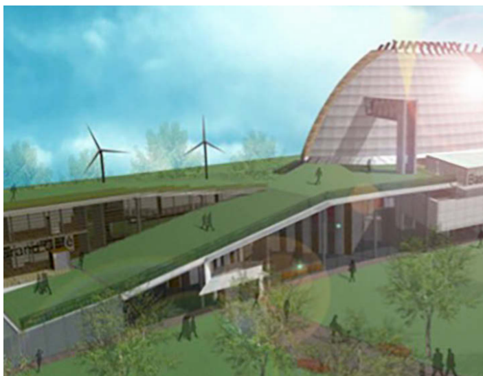
Poldermoskee in Rotterdam.