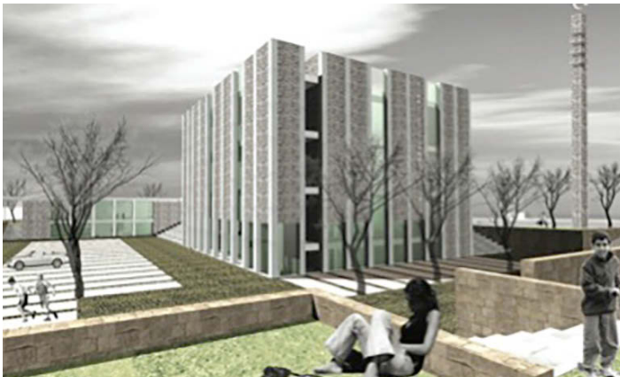
Turkse moskee in Doetinchem. Beeld: Atelier PUUUR en Forkan Köse