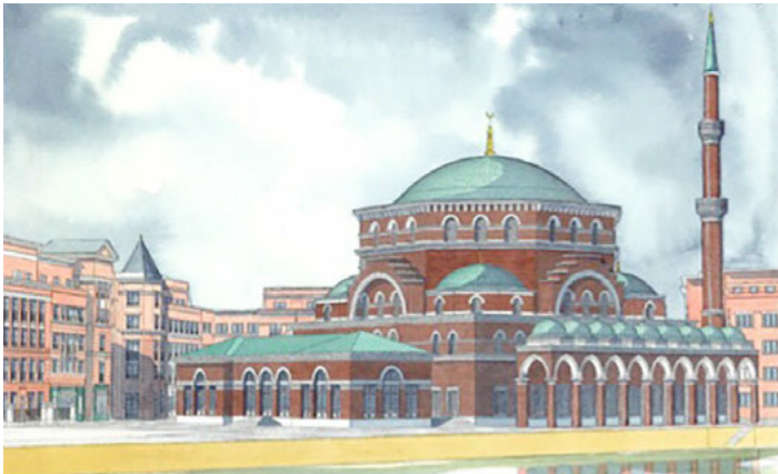
Westermoskee in Amsterdam. Beeld: Breitman et Breitman, Atelier d'Architecture en d'Urbanism.

In Doetinchem mag een nieuw geloofsgebouw niet al te kenmerkende eigenschappen hebben. Deze Turkse moskee ziet er uit als een vierkante doos. Het gebouw naar ontwerp van Atelier PUUUR en Forkan Köse wordt ook geen moskee genoemd, maar cultureel centrum.