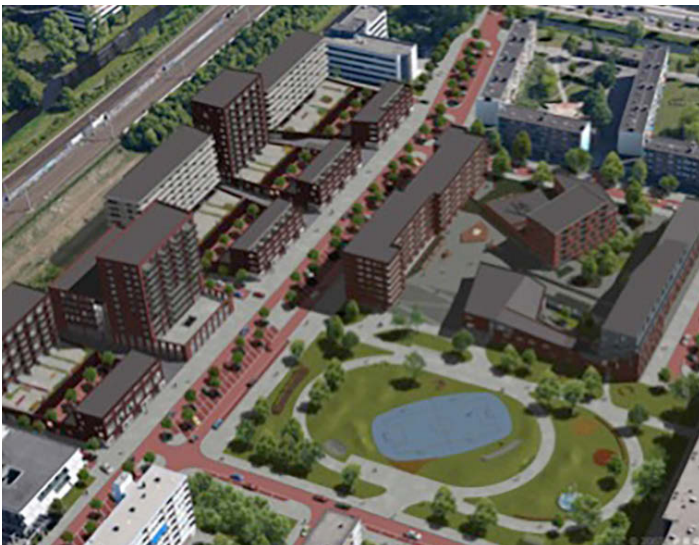
Overzicht Staalmanpleinbuurt met rechtsboven de Blauwe Moskee. Foto: Haiko Meijer.

Haiko Meijer is oprichter van architectenbureau Onix en architect van de Blauwe Moskee.