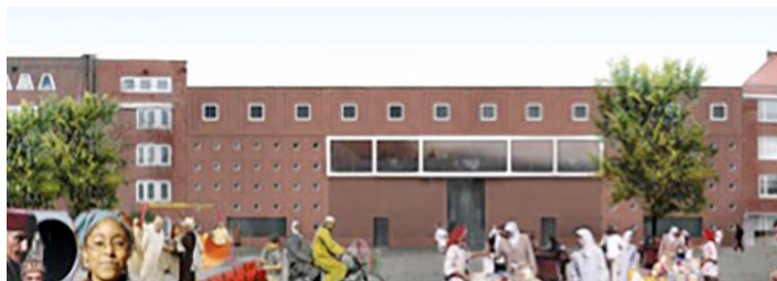
Fusionmoskee in Amsterdam. Beeld: Marlies Röhmer.

De Fusionmoskee van architectenbureau Marlies Röhmer is compleet opgenomen in de wijk. Dit gebouw staat in Amsterdam en wordt door de meeste mensen niet als moskee herkend. Zij relateren het niet aan het traditionele beeld van de koepel en de minaretten.