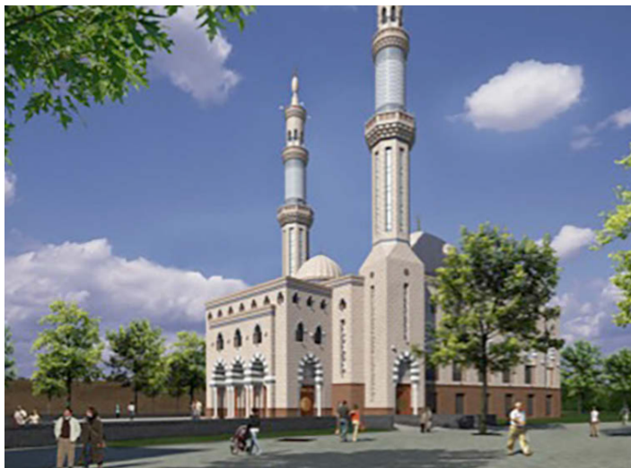
Essalam-moskee in Rotterdam. Beeld: WAM Architecten en Molenaar & Co.

De Essalam-moskee in Rotterdam van WAM Architecten en Molenaar & Co doet denken aan een suikertaart. Nederland heeft geen eigen traditie met deze bouwstijl. Buğdaci noemt dit Nederlandvreemd.