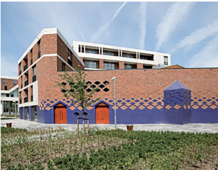
Vooraanzicht Blauwe Moskee met de plaats van de Mihrab goed zichtbaar.