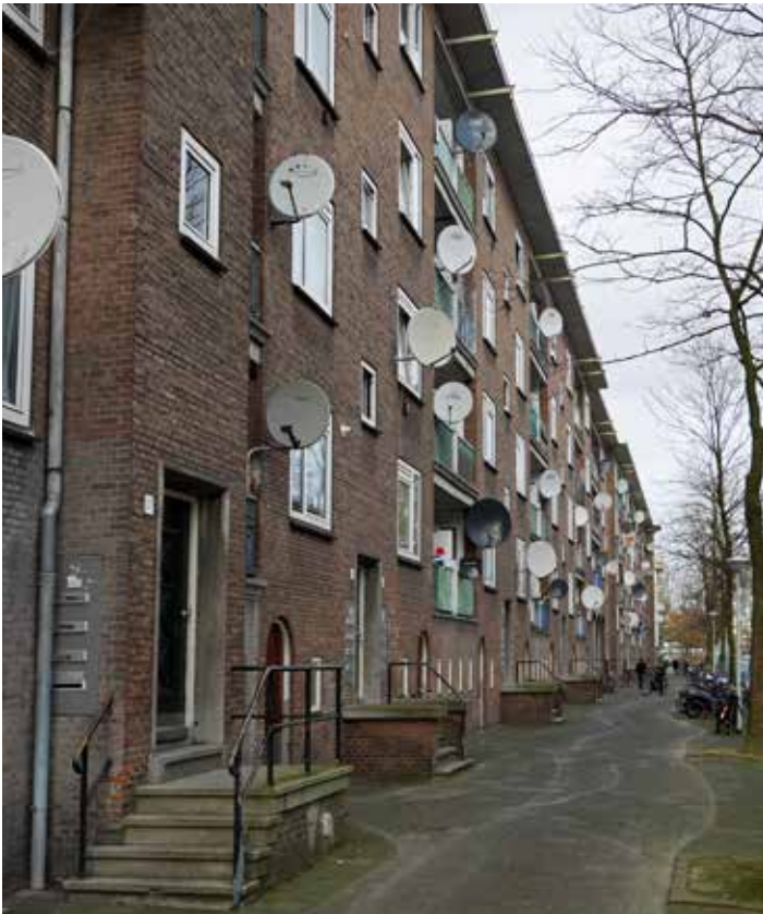
Portiekflats aan de Akbarstraat, Bos en Lommer.

Hoewel je het een niet los kan zien van het ander, gaat Nio's verhaal niet over de stedelijke vernieuwing. 'Ik ben in de eerste plaats geïnteresseerd in de dynamiek van Nieuw-West; ook los van die stedelijke vernieuwing. Welke groepen zijn groter geworden, en welke kleiner? Welke nieuwe initiatieven hebben zich de afgelopen tien jaar ontwikkeld?'