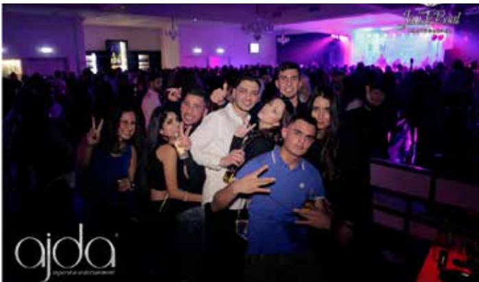
Uitgaansgelegenheid Sky Palace in Bedrijven- centrum Osdorp.

Naast deze vier groepen, die ook in de eerste versie van de atlas besproken zijn, onderscheidt Nio een nieuwe groep; de passanten. 'In de afgelopen tien jaar zijn er veel hotels bij gekomen, die toeristen naar Nieuw-West halen. Maar ook studenten vormen een belangrijk aandeel. In tien jaar tijd zijn er meer dan 4000 studentenkamers en -woningen bijgekomen, onder meer in het Sloterdijk Bricks International (650), de ACTA (460), het Student Hotel (709) en de Lelylaan International Campus AG (800). Investeerders staan in de rij want er valt veel geld te verdienen aan kleine studio's. Passanten zijn ook de starters op de woningmarkt