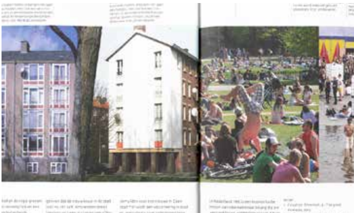
Onerlijke vergelijking in het vaktijdschrift S+RO; Osdorp versus het Vondelpark.