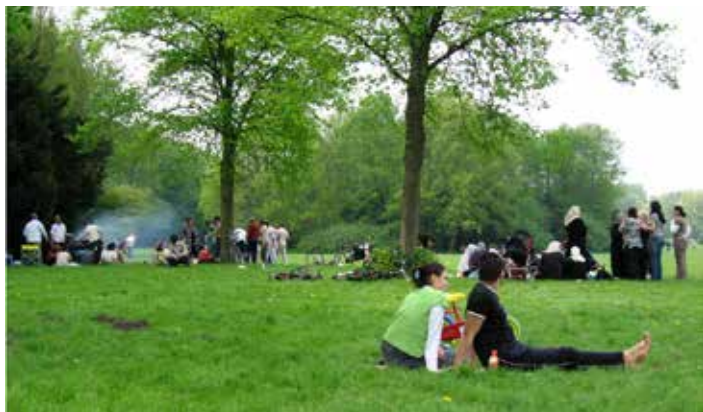
Picknick en barbecue in het Sloterpark

Het zijn dan ook vooral Slotermeer, Geuzenveld en Osdorp waar de hoogste werkloosheid heerst. Slotervaart doet het economisch goed. De verschillen lijken dus binnen de Westelijke Tuinsteden groter te worden. Een lichtpuntje is