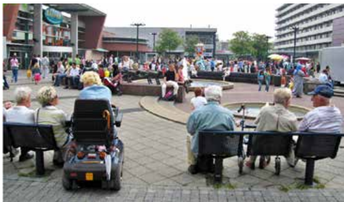
Menging van oude en nieuwe bewoners aan het Osdorplein.

'Het Osdorplein is een voorbeeld van een plek in het publiek domein waar verschillende groepen vertrouwd met elkaar raken. Ook het Sierplein weten mensen te vinden voor de markt of een terrasje. Het Sierplein trekt wel een witter publiek, het Lambertus Zijlplein weer veel donkerder, voornamelijk Turks. Alle drie de pleinen hebben een eigen soort stedelijkheid. Dat dit geen vanzelfsprekendheid is zien