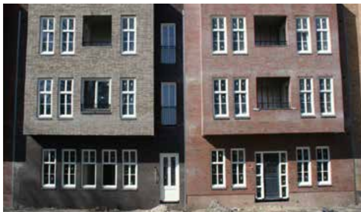
'Stadspaleizen' aan de Troelstralaan

Het aantal nieuwe stedelingen is toegenomen. Wie zijn dit? Het zijn hoogopgeleide tweeverdieners, vaak met jonge kinderen, die de sprong over de ring hebben gemaakt. Ze staan in principe open voor andere culturen en maken ook gebruik van hun voorzieningen. Vooral in Slotervaart zie je er veel, onder andere te oordelen aan het aantal bakfietsen. 'Enerzijds zie je dat daarmee ook het aantal hippe koffietentjes toeneemt, maar veel nieuwe stedelingen zijn toch ook op zoek naar een sfeer die de tuinstad van de binnenstad onderscheidt; namelijk de koppeling met het groen. En dan gaat het niet alleen om stadsparken maar ook om een toeëigening van dat groen, van een zekere mate van ambachtelijkheid. Je ziet dat bij de buurtcamping, de tuinen van West, café hotel Buiten.