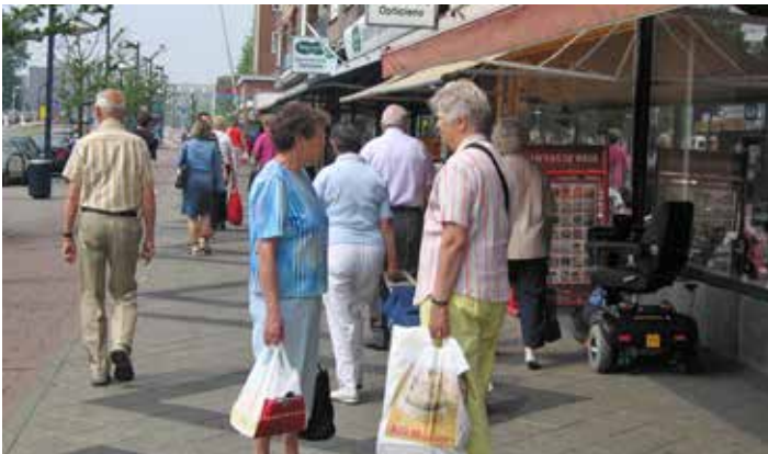
De 'oorspronkelijke stedeling' op de Burgemeester de Vlughtlaan.

De groep winkels van migranten is ook groter geworden, met name rond Plein 1940-1945 en de Burgemeester de Vlughtlaan. De Turken timmerden in 2006 al flink aan de weg maar wat Nio verraste was dat het aantal nieuwe winkels van Marokkanen, vooral in Slotervaart, ook toeneemt. 'Veel oude bedrijfsgebouwtjes zijn in gebruik genomen als verenigingsgebouw of ontmoetingscentrum. Vaak zie je dat mensen zich groeperen rond een regio van herkomst, zoals de Zwarte Zee Vereniging. Sociale cohesie speelt zich dus voor een belangrijk deel af binnen de eigen clan.'