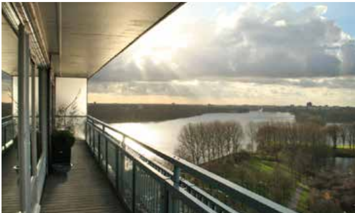
Uitzicht op de Sloterplas en Hollandse wolkenluchten.

Wat heeft een stedelijke samenleving nodig aan openbare ruimte, een ruimtelijke structuur en voorzieningen? En wat heeft een vitale economie nodig op dat vlak?