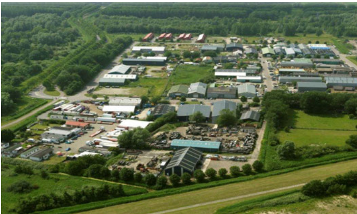
Sloterdijk 4 vanuit de lucht.

In Sloterdijk 4 zijn 60 bedrijven in loodsen gevestigd. Het is een heel groen gebied, maar ook wat duister zoals Nieuweboer het verwoordt. Het heeft de dubieuze reputatie dat Heineken er door zijn ontvoerders werd vastgehouden. Inmiddels zit