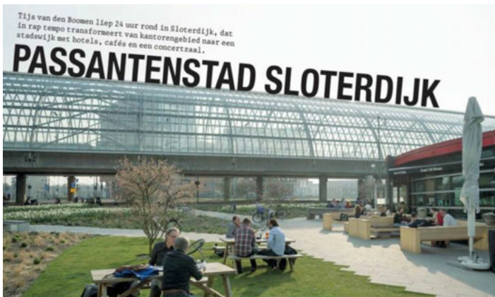
Positieve pers over Sloterdijk Centrum. Bron: het Parool 18 april 2015.