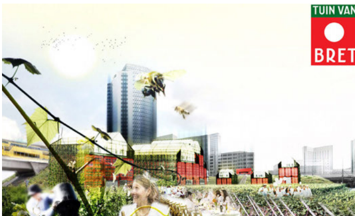
Wijngaard Tuin van Bret in Sloterdijk 2.

Het monofunctionele Sloterdijk Centrum met al haar kantoren ondergaat een transformatie naar woonwerkgebied. Daarvoor is het meest flexibele bestemmingsplan van de stad samengesteld, vertelt Nieuweboer. Van 78% kantoren naar 50% in 2020. De vrij gekomen ruimte is bestemd voor woningen, appartementen voor extended stay en hotels. Sinds de komst van het nieuwe paviljoen Bret, het evenement Pleinvrees en het nieuwe trainshotel kreeg Sloterdijk Centrum veel positieve pers.