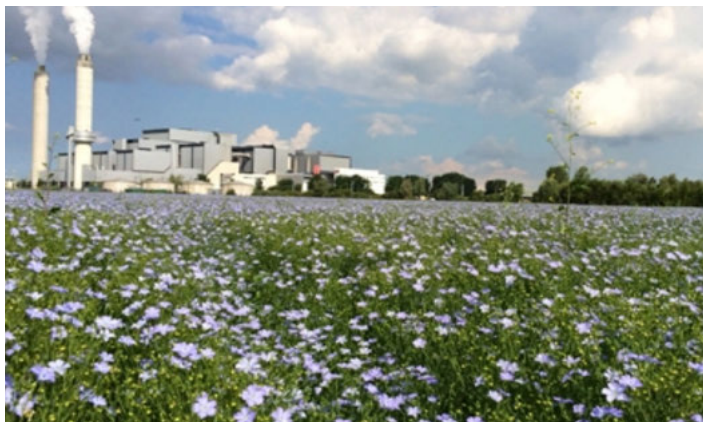
Sloterdijk 3 met als enige milieucategorie 5.

Sloterdijk 3 is ook een heel groen gebied met veel ruimte voor de vestiging van bedrijven. Er zitten nu vooral logistieke en autobedrijven, maar ook boerenbedrijven. Zo is er vorig jaar in dit gebied hennep en vlas gezaaid. Het stadsdeel zou hier graag een markthal zien met 160 culturen onder 1 dak, en een 'free zone' waar bedrijven met niet al teveel regelgeving te maken hebben. Het gebied heeft de hoge milieucategorie 5, het enige deel van de stad waar bijvoorbeeld abattoirs toegestaan zijn.