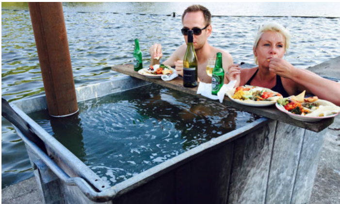
Hot tub van Koele Kachels bij Buurtwerkplaats Noorderhof

'Mogelijkmaker' zo noemden de mensen van de buurt-werkplaats het project in het begin ook wel, vanwege alle mogelijkheden die het biedt. Krasenberg vertelt over allerlei dingen die gebeuren en die niet van tevoren bedacht waren, maar waar wel bewust de voorwaarden voor waren aangebracht. Zo kwam er iemand die aanbod te koken voor iedereen die zo hard bezig was. 'Wij stimuleren dat, zo werd dat al snel een wekelijkse kooksessie en inmiddels is dat uitgegroeid tot een cateringbedrijfje.' Een ander voorbeeld is iemand die een houtkachel kwam maken. Hij werd een beetje geholpen, maakte er nog een, en nog een paar, vervolgens een pizza-oven en een hot tub. Nu fabriceert hij in opdracht voor festivals van alles. 'We zijn niet per se een plek om mensen weer aan het werk te helpen, maar het gebeurt wel. We proberen een context te scheppen waarbinnen dat soort dingen uitgelokt worden. Improvisatie is daarbij een belangrijke factor.'