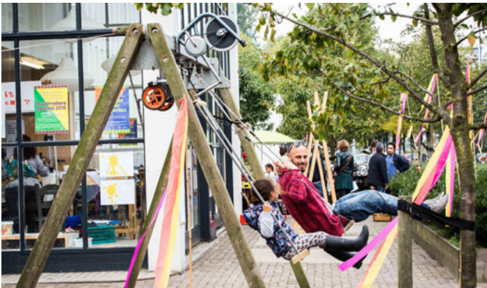
Schommelen voor energie in de buurt

Het project 'energie in de buurt' werkte goed. Mensen werden uitgedaagd zelf energie op te wekken. Zo is er een speeltuin gebouwd waarin door te spelen energie opgewekt werd. Bijvoorbeeld door te schommelen. The Beach faciliteert hierin. Het is een open plek waar mensen elkaar tegenkomen, en waar ook makers elkaar tegenkomen. Een mooi voorbeeld is de Irakese politicoloog en de Syrische cameraman die samen een film maakten. Het is balanceren tussen programma's maken en spontane ontmoetingen de ruimte geven, vindt Krabbendam. Er moet ook plek zijn voor toevalligheden.