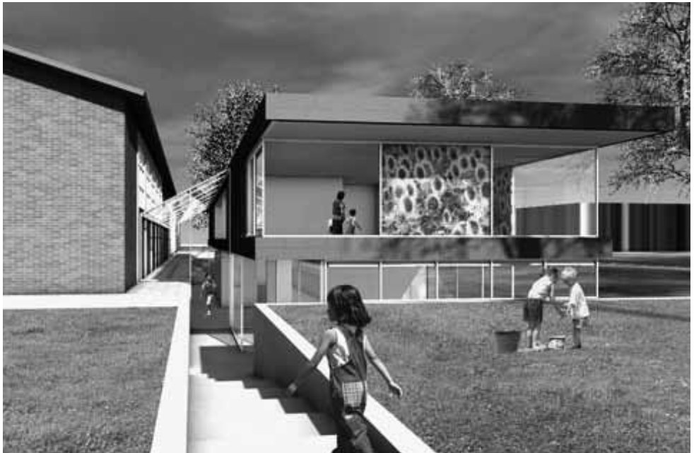
Artist impression van de nieuwe vleugel van de Slootermeerschool, door architectenbureau SKETS