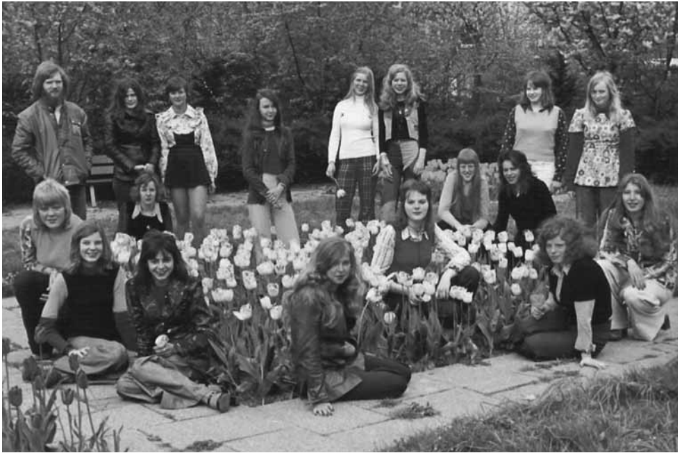
Foto uit 1973 van de Burgemeester de Fockschool, de 3e gemeentelijke huishoud- en nijverheidsschool