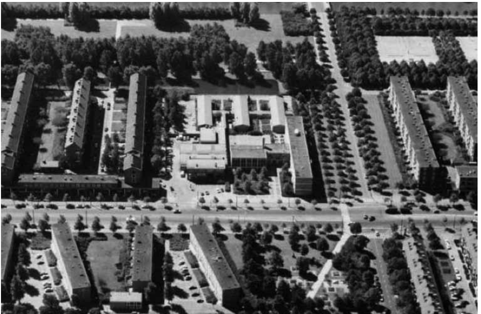
Luchtfoto uit 1974, met zicht op de Dobbebuurt, de Burgemeester de Fockschool en op de achtergrond de Sloterplas