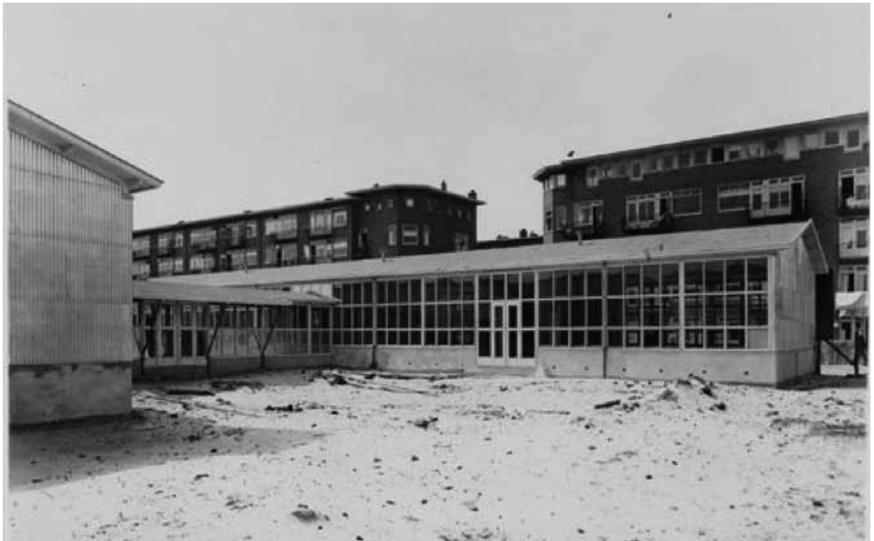
Noodschool in Amsterdam West

Voor de oorsprong van de H-School moeten we terug naar het Amsterdam Zuid in 1930, het jaar dat de - inmiddels beroemde - Openluchtschool open ging. Een voor die tijd enorm modern gebouw, ontworpen door architect Jan Duiker in opdracht van de Vereniging voor Openluchtscholen voor het Gezonde Kind. Het betonskelet met niet-dragende buitenmuren maken grote strokenramen mogelijk. Deze kunnen wijd open om frisse buitenlucht toe te