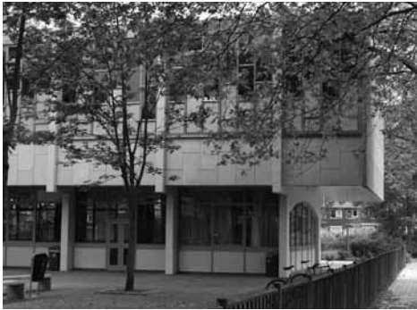
Chr. ULO, 1964, Herman Poortstraat in Sloermeer

een hoofdgebouw, praktijkzalen en gymzaal is een terugkerend element bij de scholen van Ingwersen. Net als het materiaalgebruik: betonnen gevels, platte daken en grote vensters (met roedeverdeling). En de gymzalen, allen uitgevoerd in beton, met betonnen spanten en eenzelfde roedeverdeling. Omdat de gymzaal van het Pascal Lyceum als enige is verhoogd op betonnen kolommen, is dit gebouwelement van extra bijzondere architectonische waarde.