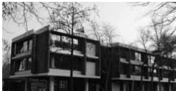
3e Christelijke Nijverheidsschool voor meisjes, 1973, Duinluststraat in Noord