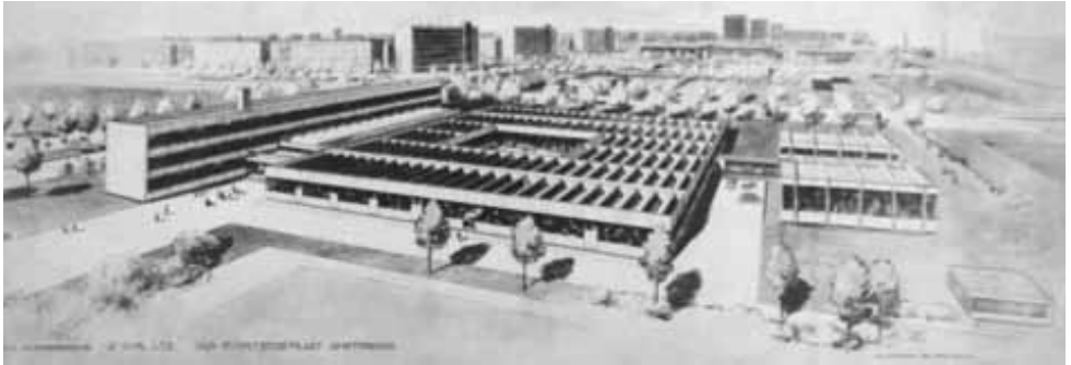
Grote 2e Christelijke LTS, 1967, Jan Evertsenstraat in Overtoomse Veld

Aan de Jan Everstenstraat, met de ingang in de Dr. Jan van Breemenstraat, staat sinds 1967 de grote 2e Christelijke LTS. De situering van het gebouw, net zoals de LTS aan de Wibautstraat, is een antwoord op het bouwbesluit uit 1921. Licht diende vanaf dat moment aan de linkerkant van een schoolgebouw binnen te komen, om zo niet de schaduw op de handen te krijgen. Het zonlicht wordt ook hier gefempered door een 'brise-soleil'. In het lage praktijkgebouw heeft Ingwersen gekozen voor sheddaken, veel gebruikt bij kwekerijen, voor een optimale lichtinval.