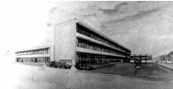
4e Christelijke Nijverheidsschool voor Meisjes, 1967, Derkinderenstraat in Overtoomse Veld

In Overtoomse Veld opende aan de Derkinderenstraat eind jaren '60 de 4e Christelijke Nijverheidsschool voor Meisjes. Net na de in gebruik name stond een enthousiast stukje in de krant over dit 'mini Hiltonhotel voor meisjes'. Een luxueuze school was het, met een in het gebouw gegoten zwevende betonnen trap. Al droegen de meisjes minirokjes, ze kregen relatief ouderwets onderwijs zo aan het begin van de tweede feministische golf met de dolle mina's. Nog heel veel jongeren gingen traditiegetrouw naar aparte scholen.