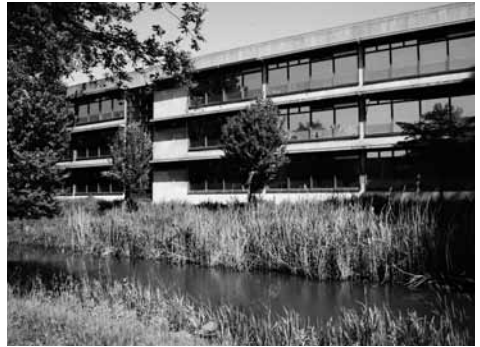
Grote 2e Christelijke LTS, 1967, Jan Evertsenstraat in Overtoomse Veld