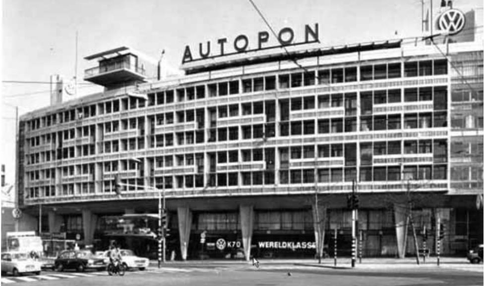
Autopton, 1961, Overtoom in West

Net als de ambachtsschool is het multifunctionele Autopton (eind jaren '50) op de Overtoom geïnspireerd op Unité d'Habitation. Het woon-en garagegebouw, vernoemd naar Pon's Automobielhandel, kan worden gezien als een schakel tussen de oude stad en de woonwijken aan de westzijde van Amsterdam, die je indertijd vanaf het gebouw in aanbouw kon zien. Zowel Het Schip als Autopton zijn inmiddels Rijksmonument.