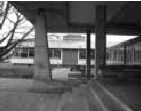
TEC-gebouw , 1972, Vlaardingenlaan in Slotervaart

Aan de Vlaardingenlaan in Slotervaart verrees in 1972 het Technisch College Amsterdam (TEC-gebouw). Omdat het een Christelijke Middelbaar Technische School (MTS) was, een hoger niveau dan de LTS, vond men dat het gebouw een indrukwekkende entree nodig had. Het resultaat was de bijzondere terugliggende entree met op kolommen de verdiepingen.