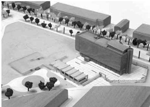
Maquette schoolgebouw 'Het Schip' aan de Wibautstraat in Oost