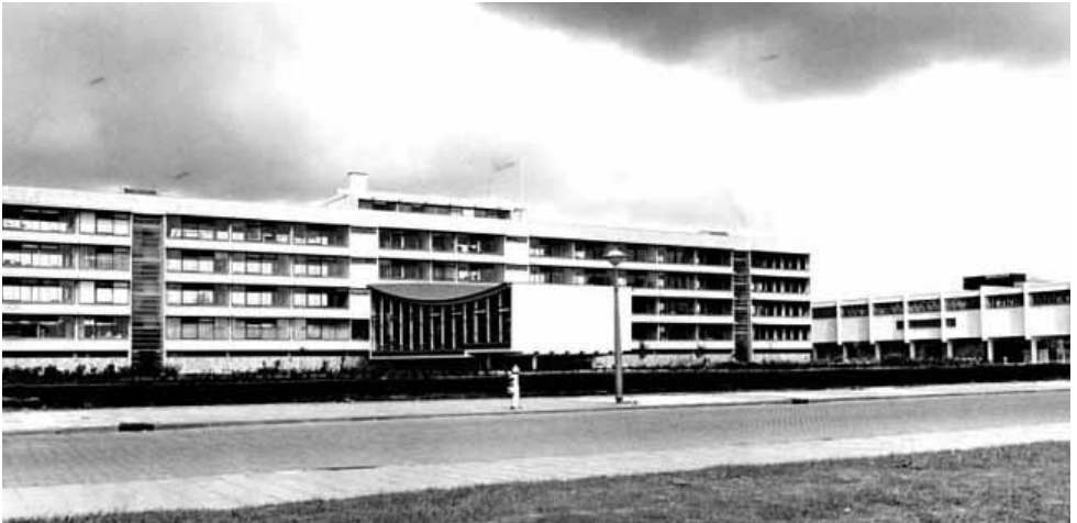
Christelijk Scholengemeenschap Pascal, 1969, Schipluidenstraat in Overtoomse Veld