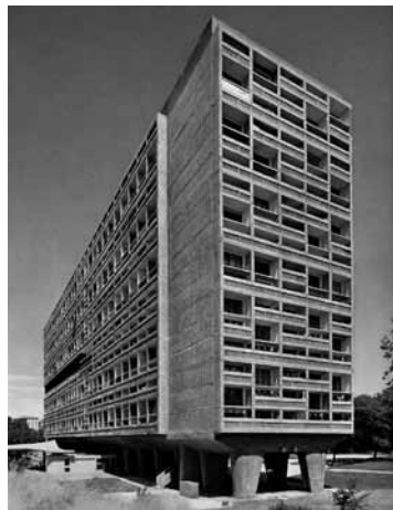
Le Corbusier's Unité d'Habitation