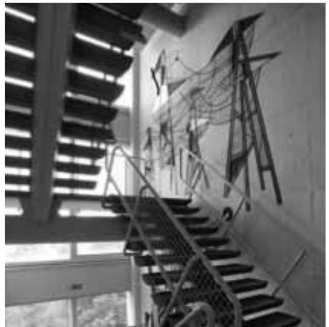
Kunst in schoolgebouw 'Het Schip' aan de Wibautstraat in Oost

Bijna elke school had een kunstwerk vanwege de procentageregeling bij overheidsgebouwen; 1% van de bouwsom werd besteed aan een kunstwerk. Zoals de betonreliëfs in de gangen en traphal van de ambachtsschool, ter plekke in bekisting in beton gegoten. Of een 26-meter hoog glasapplique in het Pascal Lyceum, gemaakt door de kunstenaar Jaap van den Broek. De combinatie van kunst en architectuur was door Le Corbusier gepropageerd. De ambachtsschool aan de Wibautstraat en de betonreliëfs zijn recent gerestaureerd. Maar dit is niet bij alle gebouwen het geval. De meeste scholen voldoen nog steeds, en doen door de ruimte en lichtinval zelfs luxe aan, zo worden ze haast niet meer gebouwd. Maar goed onderhoud is meer gewenst.