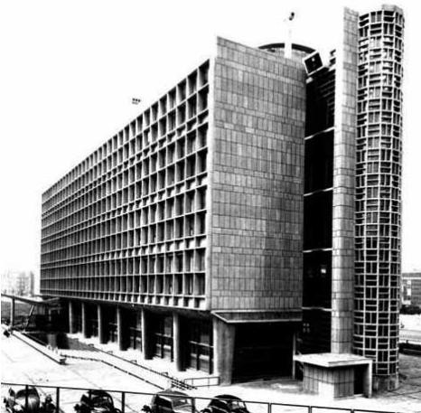
Schoolgebouw 'Het Schip', 1956, Wibautstraat in Oost

Bij de stedenbouwkundige opzet van de ambachtsschool heeft het concept 'Ville Radieuse' een belangrijke rol gespeeld. Deze ideale stad van Le Corbusier kent geen straten, maar gebouwen als op zichzelf staande elementen in een grootstedelijk landschap waarin continue groene ruimten en verkeer domineren. Functies zoals wonen en werken zijn strikt gescheiden. Ook de ambachtsschool is een op zichzelf staand element, iets gedraaid ten opzichte van de Wibautstraat, waardoor op het driehoekige terrein ruimte bleef voor het latere kantoorgebouw van Het Parool, groen en een speelplaats. De noord-zuid georiënteerde hoogbouw zorgt voor een vrij uitzicht en een optimale lichtinval. Het gebouw lijkt boven het maaiveld te zweven, doordat het bouwvolume op pootjes staat, met hier tussenin glas. Deze pilaren ('pilotis') zie je terug in Le Corbusier's Unité d'Habitation, een vrijstaande hoogbouwflat in Marseille. Hierop geïnspireerd is ook de plattegrond, met een binnenstraat waar verschillende ruimten omheen gegroepeerd zijn ('rue intérieure'), het expressieve gebruik van kaal beton in de architectuur en in de kunstwerken ('béton brut') en de in beton uitgevoerde zonwering ('brise-soleil').