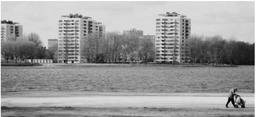
Huidige situatie van de Sloterpas

Onderbrekingen van het ontwerp leveren volgens Koevoet dan ook 'niet-harmonieuze' plekken op. Het groen en het water zijn ontworpen als doorlopende stroken die van het buitengebied de woonwijken intrekken. Het paviljoen aan de westoever van de Sloterpas, onderbreekt bijvoorbeeld zo'n groenblauwe ader en is volgens Koevoet niet geslaagd binnen de ruimtelijke vorming van Nieuw-West. Dat het paviljoen leeg staat hangt volgens haar samen met de onbewuste beleving die men heeft van het object in de omgeving.