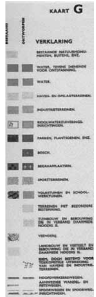
AUP kaart G - Ontspanning.