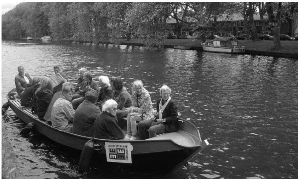
Bootje varen op de Van Tienhovengracht