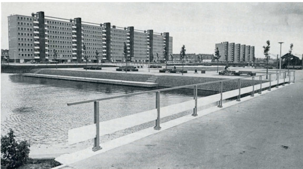
Flat Dudok en park

Daarom wederom een Van Eesterengesprek over Buitenveldert, meer specifiek: Buitenveldert-Zuid. De wijk werd als onderdeel van het Algemeen Uitbreidingsplan van Amsterdam (AUP) ontworpen, en als apart plan in 1957 vastgesteld. Het gebied ten zuiden van het - later gebouwde - Buitenveldert- Noord gesitueerd en heeft een strak vierkant patroon. In het ontwerp waren wegen gepland die de nieuwe wijk moest verbinden met Amsterdam-Oost en - Zuid. Echter werden deze verbindingswegen in de jaren '80 geannuleerd, wat ertoe leidde dat het gebied een doodlopende wijk aan de zuidrand van Amsterdam werd.