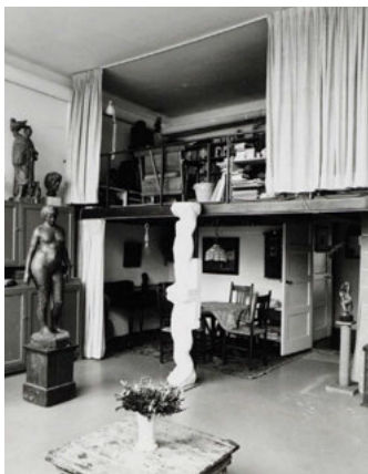
Interieur atelier van de beeldhouwer Paul Grégoire. Foto's Martin Albers, 1987, collectie Stadsarchief Amsterdam