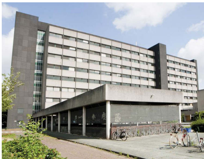
Het voormalig centrum voor tandheelkunde, de ACTA

Op stapel staat nog de transformatie van het voormalige bejaardenhuis aan het Surinameplein. Het complex uit 1960 zal worden ontwikkeld tot een broedplaats waar de komende vijf jaar werkruimtes én woon-werkruimtes worden verhuurd. De atelierwoning is dus weer helemaal terug.