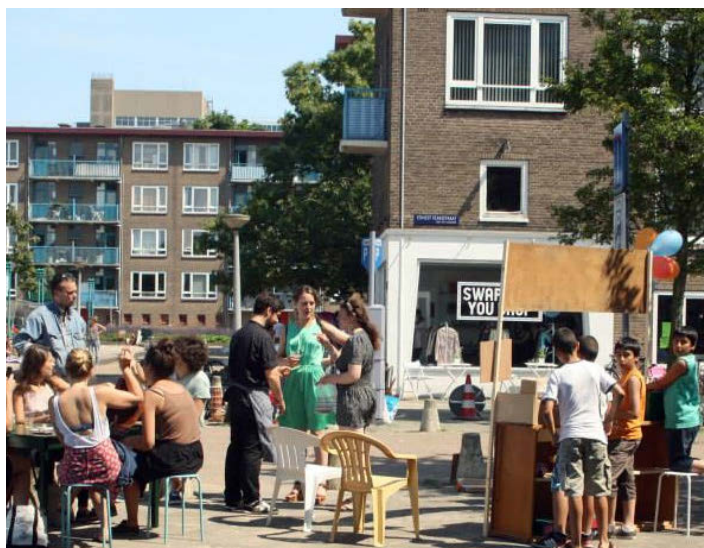
Kledingruilevent SWAP TILL YOU DROP! in THE NOVEL aan de Ernest Staesstraat 7