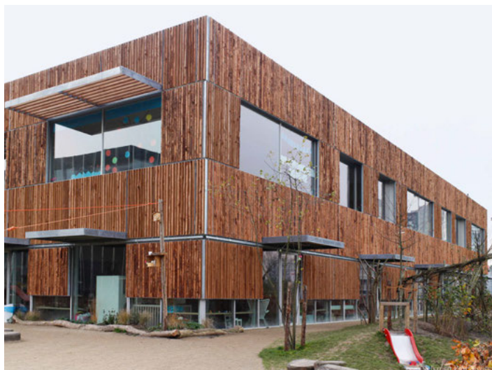
Kindercampus Zuidas. Ontwerp Hund Falk Architecten en Fact architects. Onder: bouwfasen Kindercampus 1, sloop sportcentrum en Kindercampus 2 en aanleg slotgracht.

De sporthal aan de Boelelaan - 'die nare blokkendoos' - wordt gesloopt. Daarachter is nu al het eerste gedeelte van Kindercampus Zuidas geopend. Het tweede deel komt op de plaats van het sportcentrum, het eerste deel schuift dan naar de weg toe. 'Met 650 nieuwe woningen op de Zuidas zal de vraag naar kinderopvang en onderwijs nog verder toenemen. De Kindercampus Zuidas biedt beide, en dat ook nog tweetalig. Buitenveldert verjongt!