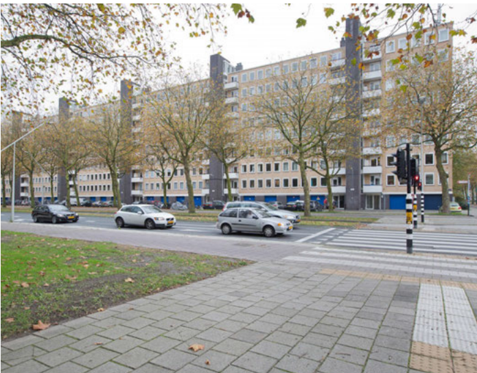
Flats en bomen aan de Van Nijenrodeweg van W.M. Dudok