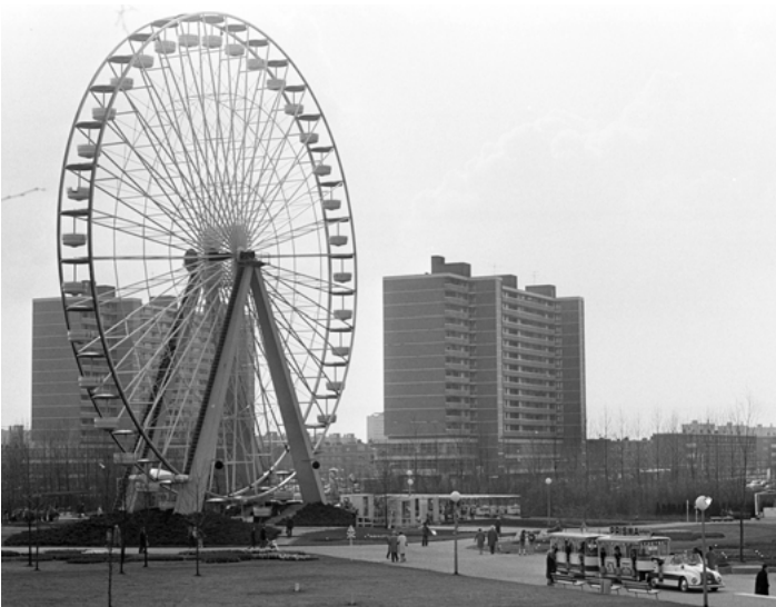
Floriade 1972. Zicht op het reuzenrad en de flats aan de Europaboulevard.