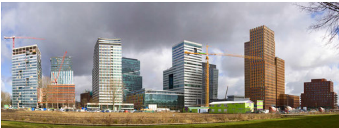
De Zuidas in aanbouw, 2011.