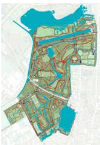
Plattegrond met zichtlijnen (l)