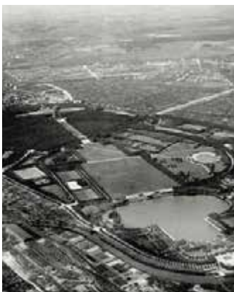
Chatsworth park, Derbyshire, UK (l) en Stadtpark Hamburg, Duitsland (r).