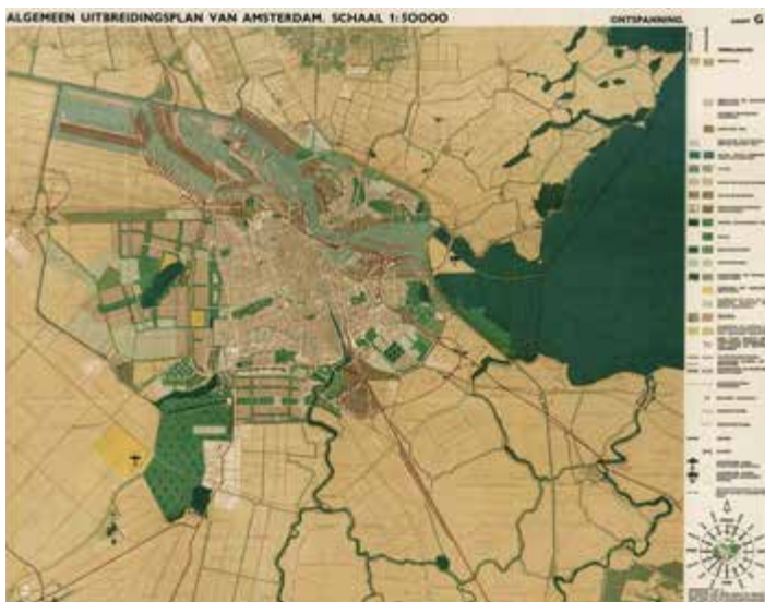
Groenplan uit het AUP, 1934, onder de titel 'ontspanning'.

Geheel in lijn met de principes van het Nieuwe Bouwen, lag aan dit groenplan onderzoek ten grondslag. Hoeveel groen per aantal inwoners en per vierkante meter bebouwing was er nodig? In de nieuwe wijken was er volop ruimte om te compenseren voor het groen dat in het centrum ontbrak.