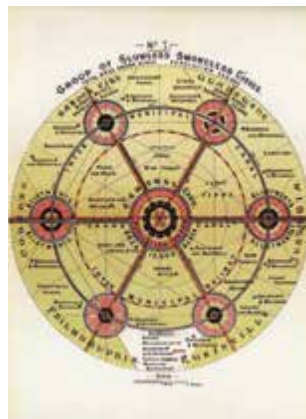
Uit: Garden Cities of To-Morrow, 1902 (oorspronkelijke titel: To-morrow: A Peaceful Path to Real Reform, 1898)