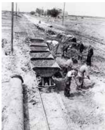
Aanleg van heuvel. Smalspoor met zand- treintje met kipkarren

'Zonder crisis was het bos er nooit gekomen.'