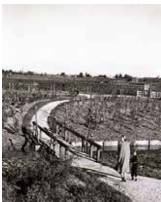
Het Amsterdamse bos is geopend. (1964)