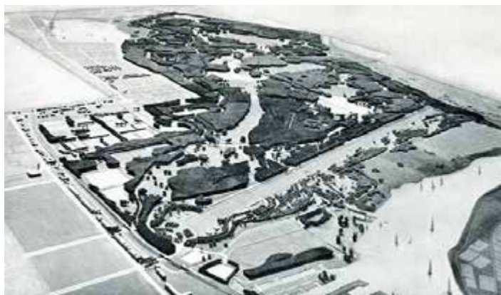
Maquette van het Bosplan, gezien van Noord naar Zuid.

In totaal hebben zo'n 20.000 mensen meegewerkt aan de aanleg van het bos. Naast de ongeschoolde arbeid die via de Werkverschaffing kon worden aangevraagd, kon via het Werkfonds een groeiend aantal geschoolde werklozen bij infrastructurele projecten worden ingeschakeld. 'Zonder crisis was het bos er nooit gekomen.'