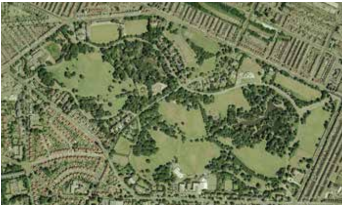
Birkenheadpark, Joseph Paxton, 1844