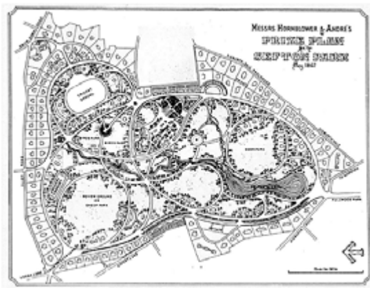
Sefton Park, Bradford, 1867

De Britse stedenbouwkundige Ebenezer Howard verwerkte deze ideeën in een nieuw concept waarbij bewoners zouden worden ondergebracht in satelietsteden waarbij ze het goede van het platteland konden combineren met de voordelen van de stad; het zogenaamde tuindorp .