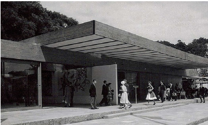
Sverre Fehn, Noors paviljoen, Brussel 1958

Bij het ontwerp van het Van Eesteren Paviljoen heeft het bureau zich laten inspireren door het werk van de Noorse architect Sverre Fehn. Deze architect heeft in de jaren vijftig en zestig eenzelfde bewerking gemaakt die het bureau Korteknie Stuhlmacher nu probeert te maken. Namelijk het vertalen van een harde architectuurtaal in een tactiele architectuur met eigentijdse duurzame materialen. Fehn heeft in 1958 een eenvoudig, open en luchtig paviljoen van hout gebouwd voor de Wereldtentoonstelling in Brussel. Het haptische en de textuur maken het warm en huiselijk. Een paar jaar later heeft hij in Venetië een vergelijkbaar paviljoen in beton gebouwd, met behoud van de optimistische ruimtelijkheid maar wel met de tactiele rijkdom van de houtbekisting en het spel van licht en schaduw. Met dit paviljoen heeft Fehn aangetoond dat het modernisme en de nabijheid van en liefde voor de natuur samen kunnen gaan. Deze combinatie maakt het Scandinavische paviljoen op de Biënnale in Venetië juist in deze tijd een geliefd project en ook een van de meest geciteerde moderne bouwwerken. Scandinavische architecten zijn erin geslaagd om het modernisme een menselijk en warm gezicht te geven dat wij nu met ons huidige duurzaamheidsdenken direct over kunnen nemen. Dit toont Sverre Fehn op prachtige